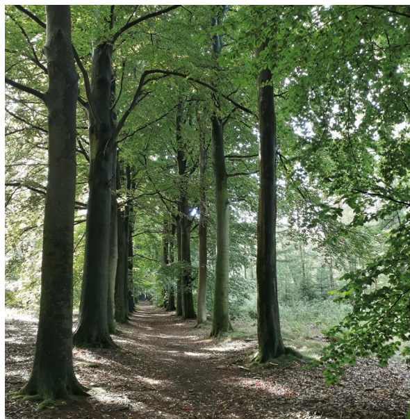
Lanen van het landgoed.