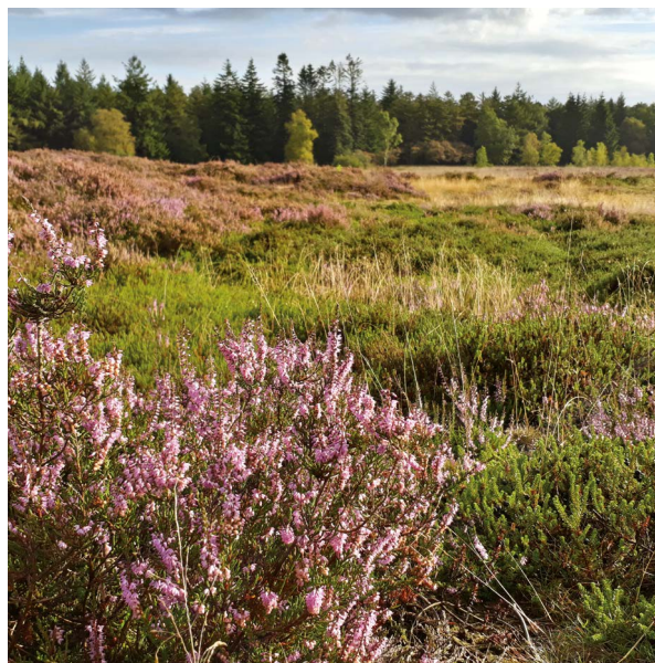
Struikheide en kraaiheide op het heideveld.

‘Heide’ is niet alleen de naam van een landschap, maar ook van de planten die dat landschap stofferen. De beeldbepalende heideplant is hier de struikheide, die in de nazomer bloeit. De paarse bloemetjes worden druk bezocht door bijen. Op deze plek zijn ook de donkergroene, naaldboomachtige kruipende takjes van kraaiheide te zien. Diens bloemen stellen weinig voor, maar ’s zomers vallen wel de bessen op, die zwart glanzen als een kraai. Wie goed zoekt kan ook de derde soort ontdekken: dopheide. Die groeit op vochtige plekken. De bloemen zijn roze belletjes, in een trosje bijeen aan het topje van de plant.