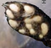
Hilma van Putten

Het verschil met de kat is te zien aan de grote zoolbal: bij de kat is deze rond, bij de steenmarter v-vormig.