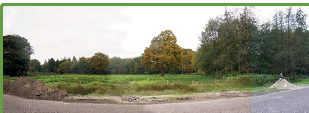
Impressie aanzicht WZA terrein vanaf Port Natalweg