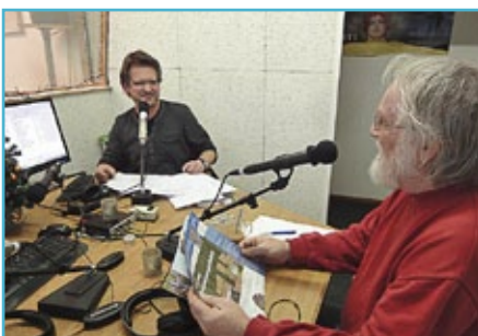
Aandacht voor het Nationaal Park Drentsche Aa bij radioprogramma.