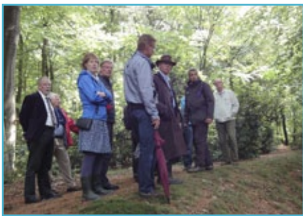
Op excursie in het gebied.