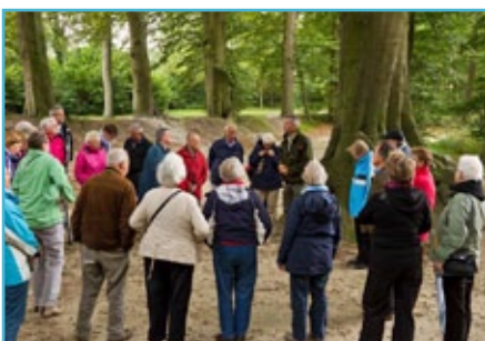
Bewonersdagen: een kijkje in 'eigen achtertuin'

Op 17 september vond de bewonersdag plaats in de omgeving van Grolloo en Elp. Met 90 bewoners bezochten we o.a. de beek bij Oudemolen, het Quintensbos en de Strubben-Kniphorstbosch. Onderweg werden de deelnemers door medewerkers van het NP&NL Drentsche Aa, het Waterbedrijf Groningen en Staatsbosbeheer geïnformeerd over het landschap, projecten en bezienswaardigheden. Uit de waardering die door de bewoners wordt uitgesproken blijkt de behoefte van bewoners om hun eigen leefomgeving en de Nationaal Park/Nationaal Landschap organisatie beter te leren kennen.