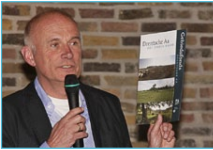
Instelling van het Gebiedsfonds