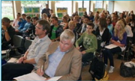
Presentatie van het Nassau College