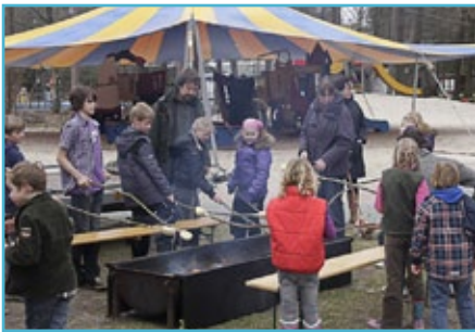
Dag van de Drentsche Aa