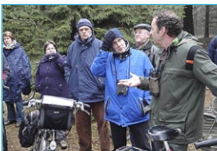
Drentsche Aa gidsen op excursie met de boswachter

Het Nationaal Landschap Drentsche Aa beschikte in 2011 over een pool met 39 enthousiaste en kundige Drentsche Aa gidsen. Samen verzorgden zij over de 100 gebiedsexcursies. Reguliere excursies uit het jaarprogramma maar ook externe excursieaanvragen voor maatwerkexcursies. Naast het excursie programma verzorgen zij ook de externe excursieaanvragen en assisteren de gidsen bij Drentsche Aa activiteiten waaronder markten (Streekmarkt Loon, schaapherdersfeest Balloo en Staatsbosbeheer fair bij het Boomkroonpad) en diverse onderwijsprogramma's voor zowel basis- als voortgezet onderwijs. De coördinatie, scholing en kwaliteitsbewaking van het Drentsche Aa gidsennetwerk wordt verzorgd door de C&E medewerkers.