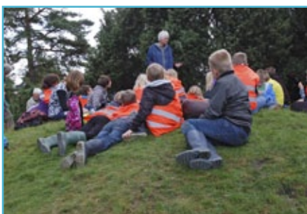
Onderwijsprogramma voor basisschool

In maart verzorgde de medewerker van C&E weer een Drentsche Aa bewoners-cursus. In drie avonden en een fietsexcursie krijgen de cursisten informatie aangeboden over het ontstaan van het Drentsche Aa landschap en de wijze waarop de mens hiermee is omgegaan. In totaal hebben 20 gebiedsbewoners de cursus gevolgd. De excursie is in samenwerking met Staatsbosbeheer en Drentsche Aa gidsen uitgevoerd. De komende jaren wordt de cursus naast de bewonersdag(en) aangeboden.