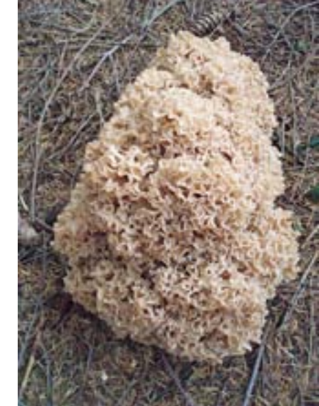
Grote sponszwam

"In verband met bossen moet ik ook lanen en wegbermen met oudere bomen noemen. Die zijn heel waardevol voor paddenstoelen, vooral als ze schraal zijn, dus met kort gras en veel mos. Dat zijn vaak bermen waar het gras gemaaid en afgevoerd wordt. Een voorbeeld bij uitstek in het Drentsche Aa-gebied is het landgoed Vennebroek bij Paterswolde met zijn oude lanen. Daar wordt ook een voor paddenstoelen goed beheer gevoerd. Je vindt er allerlei zeldzame soorten die vrijwel alleen in lanen voorkomen, zoals de goudgele koraalzwam en de avondroodstekelzwam. Het zijn soorten die heel voedselarme plekken nodig hebben. Vroeger kwamen ze ook in bossen voor, maar door de toevoer van stikstof via de lucht zijn hun groeiplaatsen daar verdwenen onder een dikke laag strooisel. Lanen en schrale wegbermen vormen een uitwijkplaats voor deze groep soorten. Het is dus zaak daar zorgvuldig mee om te gaan!"