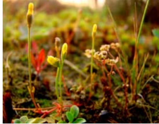
Draadgentiaan en dwergvlas

De nieuwe natuur van de Holmers, brongebied van het Amerdiep, ontwikkelt zich tot een hotspot voor bijzondere planten. Rietorchis en moeraswespenorchis breiden zich er duidelijk uit. Deze zomer kwam daar rond wintergroen bij, een plantje dat buiten de duinen erg zeldzaam is. En als klap op de vuurpijl was er de vondst van draadgentiaan en dwergvlas, twee even zeldzame als kleine plantjes die van kale plekjes op vochtige, schrale grond houden. Plantenkenners vonden de uitbundige groeiplek van dit exclusieve duo tijdens een speciale inventarisatieweek, georganiseerd door de Werkgroep Florakartering Drenthe, waar liefhebbers (vrijwilligers) uit het hele land aan deelnamen.