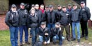
Op pad met gidsen 3