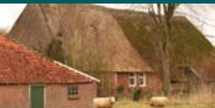
Dorp in beeld 4