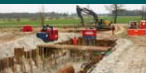
Van Aa naar Beek 7