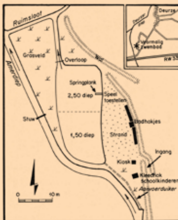
Tekst: Rolder Historisch Gezelschap Tekening zwembad Deurze: © Geschiedenisboek Rolde, F.D. Horjus