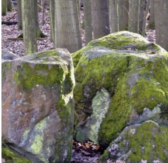
Strubben hunebed - JOKE WÖHLER