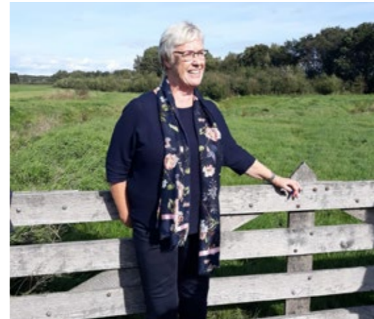
Fien Heeringa Foto Waterschap Hunze en Aa's

Een tweede probleem is de stikstof die uit de lucht op het gebied neerdaalt en die afkomstig is van industrie, verkeer en landbouw. De natuurkwaliteit van de beekdalen van de Drentsche Aa staat of valt met schrale omstandigheden. De stikstoftoevoer is een soort bemesting, die deze schrale omstandigheden tenietdoet. Daardoor verdwijnen de bijzondere plantensoorten en krijgen een paar algemene soorten de overhand. De begroeiing wordt eentoniger en armer. Ook dieren kunnen daar last van hebben, bijvoorbeeld