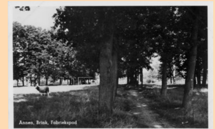
Halverwege het fabriekspaadje, kijkrichting noordwest.

Er was eens, aan een paadje op die grote brink in Annen, een fabriekje: het 'Botterfabriekje'. Een lang bestaan was het niet gegend. Wat wil het geval? Zoals in de meeste zanddorpen waren er in Annen van oudsher veel schapen, maar in de negentiende eeuw kwamen er ook steeds meer koeien bij. Voor de melk maar vooral ook voor de boter, die gewoon thuis op de deel gekarnd werd en meestal via de plaatselijke kruideniertjes verkocht werd. Deze huisboter was daardoor heel wisselend van smaak en kwaliteit en ook de hygiënische omstandigheden lieten dikwijls te wensen over. Maar door de toenemende mechanisatie en de grote landbouwcrisis aan het eind van die eeuw stelde men steeds hogere eisen aan de hygiëne en aan de kwaliteit. Steeds meer boermarken en particulieren gingen hun krachten bundelen in coöperaties met kleine fabriekjes, vaak op handkracht, later steeds meer op stoom.